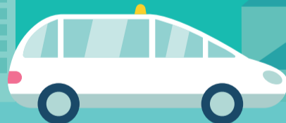
VSL* ou TAXI CONVENTIONNÉ