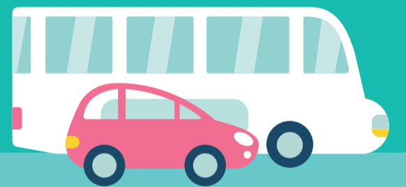
VÉHICULE PERSONNEL OU TRANSPORTS EN COMMUN

En cas de prise en charge de votre transport, votre médecin prescrit le mode de transport le plus adapté à votre état de santé.