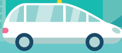
VSL* ou TAXI CONVENTIONNÉ